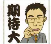
菅井 竜也 七段