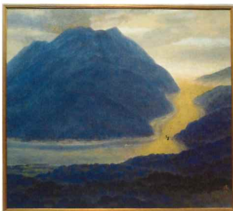
「気」 福本 達雄 2007年 日本画 160cm×180cm

京都画壇日本画秀作展他招待出品、日展特選・白寿賞、日展会員賞、京都画壇日本画秀作展優秀賞、京都府文化功労賞